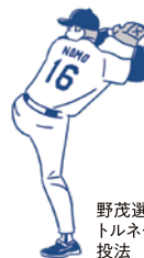
野茂選手のトルネード投法

件により社会不安が広がりましたが、野茂英雄投手がMLBで「トルネード旋風」を巻き起こすなど明るい話題も。大谷翔平選手が活躍する現在と同様にMLBが注目された1年でした。