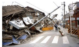
阪神・淡路大震災